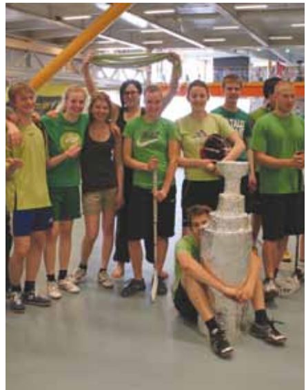
Sählyturnauksen voittajaryhmän opiskelijoita.

Oppilaskunnan hallituksen yleismies 2010 ja puheenjohtaja 2011