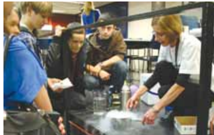
Höyryävää jäätelön valmistusta.

Viikko huipentui perjantaina Kvantissa pidettyyn palkintojenjakotilaisuuteen. Samalla fysiikan opettajat esittelivät erilaisia fysiikan ilmiöitä. Nestetypen avulla jäädettiin suklaapusuja ja tyhjiöpumpun avulla tutkittiin, miten pusu käyttäytyy hyvin pienessä paineessa. Välitunneilla valmistettiin nestetypen avulla jäädytettyä jäätelöä, jota nopeimmat ehtivät maistelemaan.