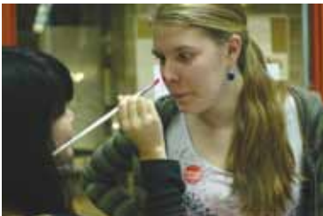
Red Nose Day.

AICE students were conspicuous in their role organising International Week in November. Each day music from a different part of the world was played over the speaker system. Many rose to the challenge of wearing a hat - any hat - from anywhere in the world. The ever-popular international show brought out the considerable talent which exists within the school community. Stalls in the foyer added colour and vibrancy as students flagged up countries in which they have lived. The week culminated with Red Nose Day activities in the centre of Tapiola.