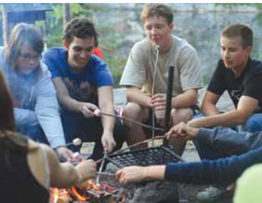
Pre-DP students in Nuuksio.

The academic year commenced with the pre-DP students being thrown into the deep end. The long anticipated “boot-camp” took our fresh faced new intake to Nuuksio National Park for a night under canvass and a programme of walks and games. This proved to be a valuable ice-breaker. Most students enjoyed the experience, although a couple were daunted by it. This is definitely something worth repeating, albeit with rather more planning and fuller mental preparation for the expedition ahead.