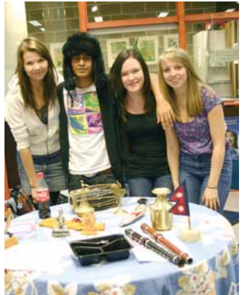
International week at Etelä-Tapiola.