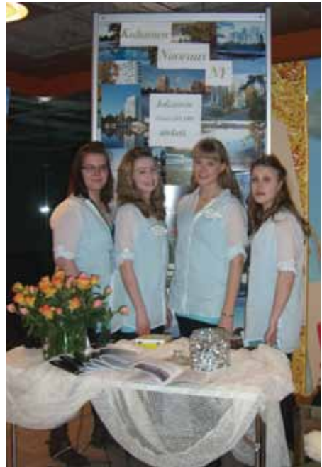
Kultainen Nuoruus NY.